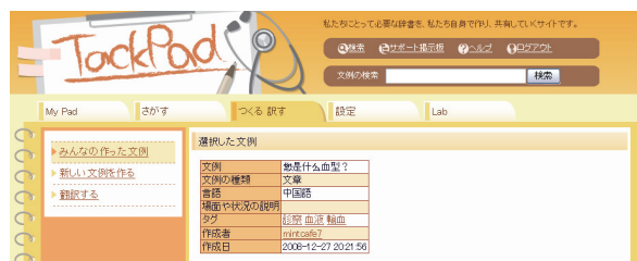
図 1 TackPad の画面例 Fig. 1 Screenshot of TackPad.

本システムは、多言語用例対訳を収集するため画面インタフェースを多言語としている。本システムの画面例を図 1 に示す。本システムは、日本語と実質の世界標準語である英語、在日外国人の上位 3 国の言語である中国語、韓国・朝鮮語、ポルトガル語の用例を収集している 1) 。また、利用者の要望をもとにスペイン語、ベトナム語、タイ語、インドネシア語も収集しており、現在 9 言語の用例対訳を収集している。なお、PHP と MySQL を使用して