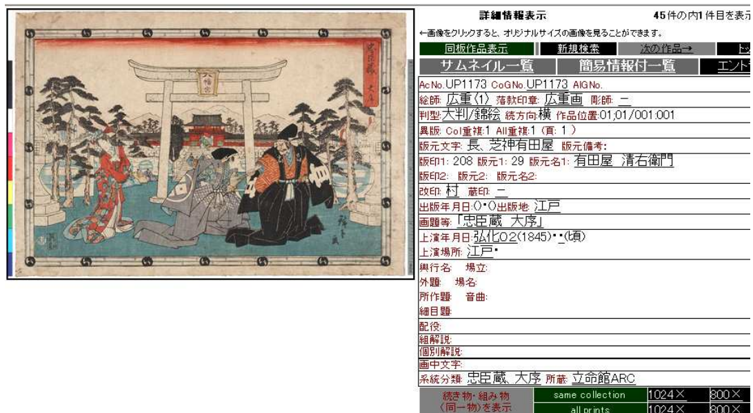
図 2. 立命館大学 ARC 所蔵 浮世絵検索閲覧システム 検索結果

図 1 は、立命館大学 ARC 所蔵 浮世絵検索閲覧システムの検索画面である。「絵師」、「彫師等」、「画題等」など、様々な項目をキーワードとして浮世絵の検索を行うことができる。利用者がキーワードを入力して検索を行うと、検索結果として該当する浮世絵の候補が提