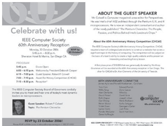
図-1 記念式典の案内状

続いて 60 周年記念事業の 1 つである、学生による Society's history competition award の結果が発表され