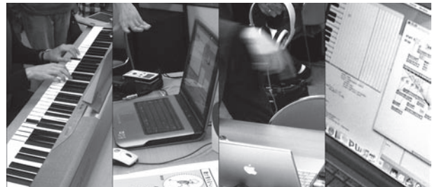
◆図-2 デモセッションの様子

10年前には、音楽情報処理は「遊び・趣味」でなく「研究」であることを認めてもらうための説明が必要だったのに対し、今日ではそれが重要な研究分野であることが広く認知されるようになった。音響処理と記号処理の融合、ノンバーバルコンテンツ処理、混合音の統計的信号処理等に関する新たな枠組みが同分野から生まれつつあり、他分野とのより一層の交流も通じて、今後、さらに多くの研究者・学生の方々が、音楽情報処理の研究を始めることが期待される。音情研と国内外の同研究分野の、今後のさらなる発展が楽しみである。