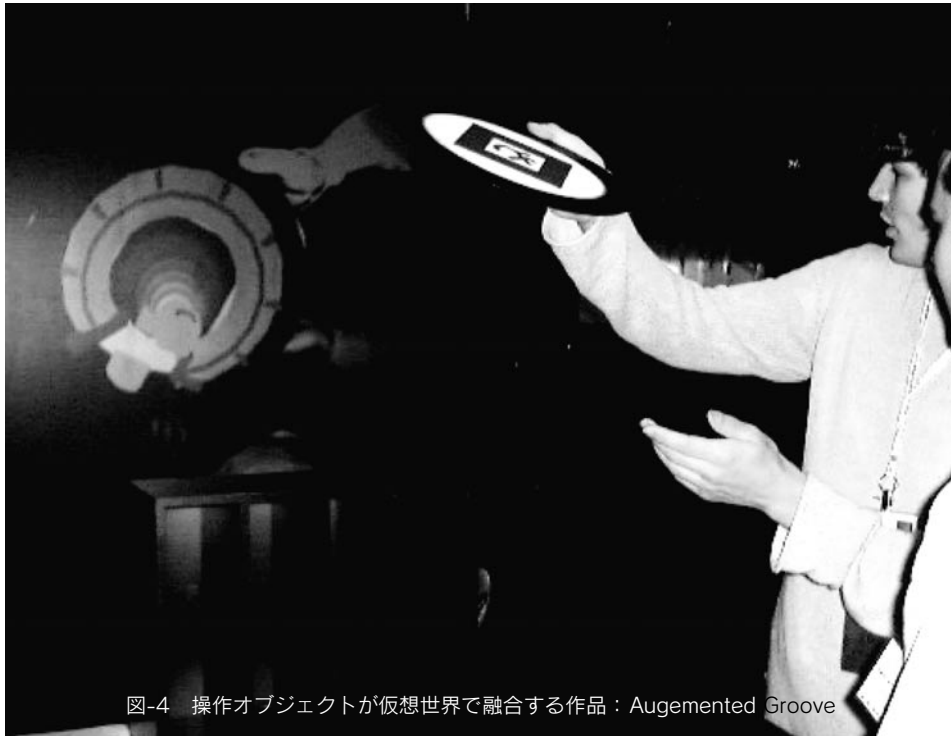
図-4 操作オブジェクトが仮想世界で融合する作品：Augemented Groove

ピューター・エージェントが言葉の掛け合いで詩を創るというコンセプトのシステムである。