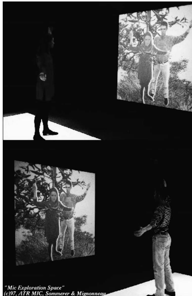
図-2 グラフィクスと自己像を融合する作品： MIC Exploration Space ((c) Sommerer & Mignonneau)