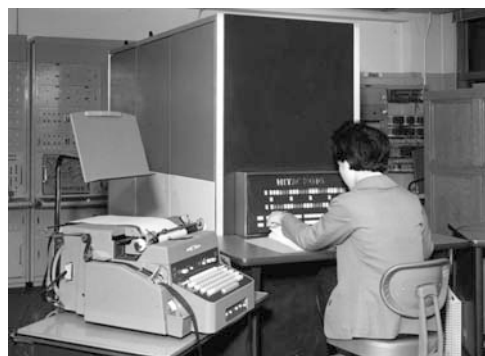
図-1 日立中央研究所三浦研究室で計算機制御の研究に使用中のHITAC 2010

日立では6月10日の会議で新機種をIBMと互換にする方針を決めたが、新機種までの繋ぎとして2010を発表するかどうかという問題が残った。得失半ばして決定が難しかったが、11月になってコンピュータ事業部長滝田勝三が、2010の試作は完成するが、製品化はしな