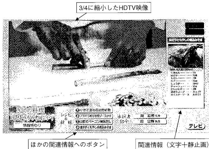
図-2 番組補完情報画面例