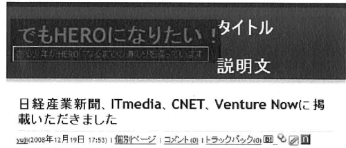
Fig. 3 blog 説明文 2

本稿では splogger の特定を行うための特徴量の有効性と、特徴量の傾向を示すため単純なモデルを用いたい。このため、最もシンプルなナイーブ