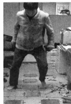
図2 適用実験の様子

被験者は和歌山大学システム工学部の20代学生8名である。図2に実験の様子を示す。実験ではサーバに接続後、被験者にスタンバイボタンを押してもらい、ディスプレイに表示されるカウントダウンに合わせてゲームがスタートする。5往復でゲームが終了する。折り返しと周回数、およびゴールの判定を行うため、行きの場合には一番奥に配置した圧力センサを、帰りは一番手前の圧力センサを確実に踏まなくてはならないことを被験者に説明した。