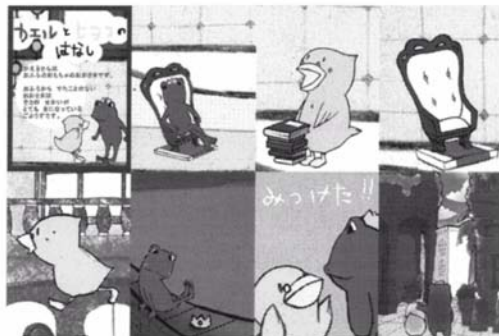
図 4 アニメーション例「カエルとヒヨコのはなし」

また、2 種類のキャラクターを同時にセンサ上に載せると、それらのキャラクターが登場する、上述したものとは別のアニメーションを提示する(図 4)。例えばヒヨコは単独では「空を飛びたいなあ」と思っていることを表すアニメーションが表示されるが、普段の仕事は王様であるカエルに仕える執事であり、カエル