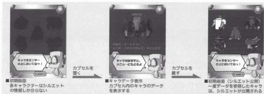
図 6 キャラクターの説明画面 Fig. 6 Interface of an instruction of a character