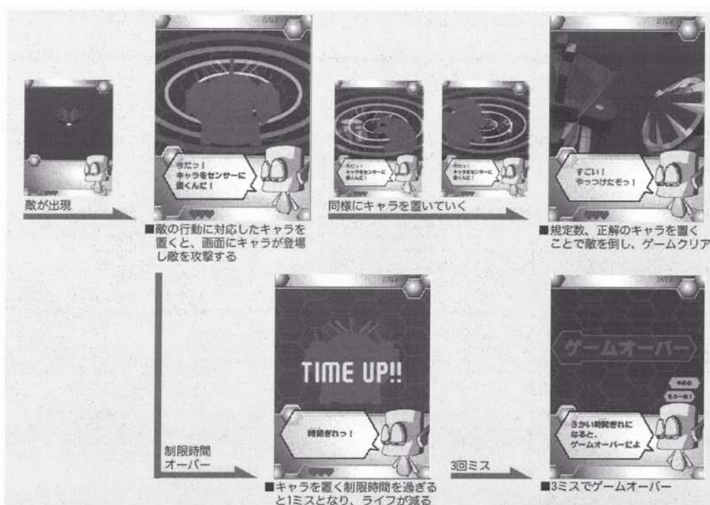
図 7 戦闘手順のフローチャート Fig. 7 The flow chart of the battle