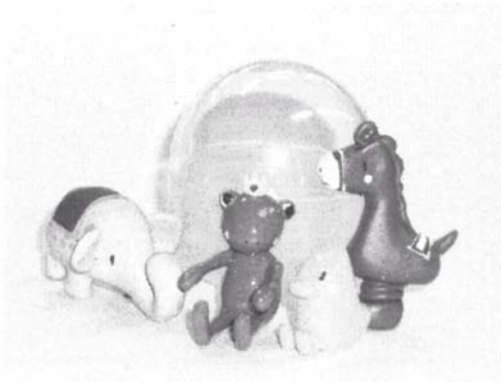
図 3 カプセル及び人形の例