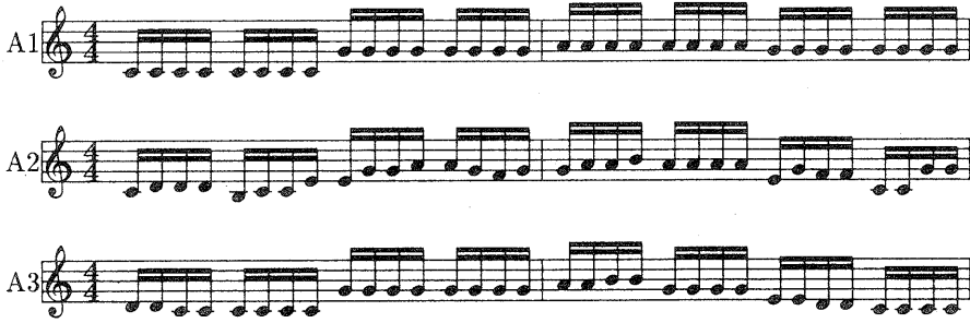
図 1: 指標 A で問題となるフレーズ