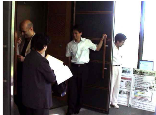
図3. 演当日の聞き比べ風景