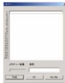
図5 メロディーパターン指定ダイアログ（デフォルト状態）

感性語を選択後、メインダイアログのメロディーパターンの変更ボタンがアクティブになる。このボタンを押すと、メロディーパターン選択ダイアログが立ち上がる。このダイアログの作成ボタンを押すと、格納された感性語の特徴量をパラメータとして、メロディー生成アルゴリズムにより 1・2・4 小節分のメロディーパターンをそれぞれ 5 パターンずつ生成され、表示される。ユーザはこのパターンの中から演出意図に近いものを選択し、そのパターンが呼び出す。また、演出意図に近いものがない場合には、「なし」も選択でき、作成ボタンを再度押すことによって、メロディーパターンの再生も行うことができる。感性語が選択された時点ではデフォルトでなにも選択されていない。