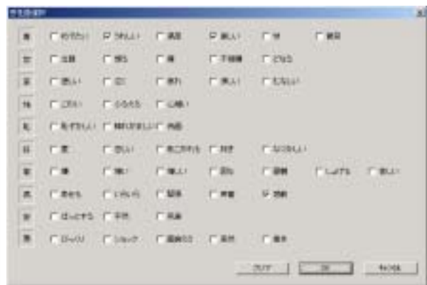
図3 感性語選択画面

感性語にはそれぞれ、調、音程、和声、リズムといった先ほどの音楽特徴量に加えて、ロック、ダンス/テクノ、ポップ/バラード、童謡/アニメ、フォークといったジャンル別の特徴量のパラメータが主に-5から5までの整数によって設定されている。ユーザがこの感性語の中から制作したい音楽の演出意図に近いものを選択することによってこれらのパラメータの値が格納される。また、感性語を複数選択するとそれぞれのパラメータ同士の平均値が自動計測される。