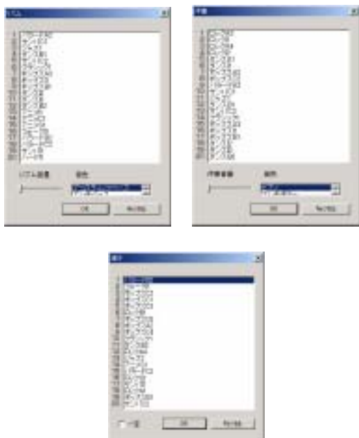
図4 曲構成パターン（リズム・伴奏・進行の選択）ダイアログ（感性語：あこがれる、めでたい、楽しい）

に特徴量が設定されており、ダイアログが呼び出された時点で格納された感性語の特徴量と内積計算が行われ、相関量の高い順にパターンデータがソートされた状態で上位 20 パターン表示される。ユーザはこの 20 パターンのタイトルの中から演出意図に近いものを選択すると、そのパターンが呼び出される。また、演出意図に近いものがない場合には、「なし」も選択できる（進行の場合はコード進行が一定の「一定」）。感性語が選択された時点ではデフォルトで一番相関度の高いデータが選択されている。