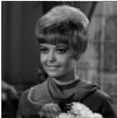
(a) 提案手法の復号画像