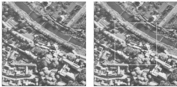
(a) 原画像 (b) 白枠：注目領域