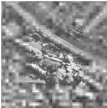
(b) 従来手法の復号画像 情報量 約 50%