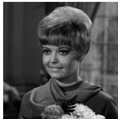
図 3: 原画像 ( 256 \times 256 )

原画像を 256 \times 256 画素の画像 (図 3) を用いて、原画像を分割する手法と Detail 成分を分割する手法の処理を行い、低周波数なものから徐々に伝送していく。提案手法 (Detail 成分を分割) と従来手法 (原画像を分割) を比較するために、伝送途中の情報量がほぼ同一の画像を用いて比較を行った。その結果を図 4 に示す。