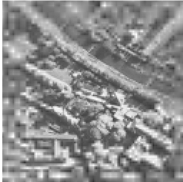
(a) 提案手法の復号画像