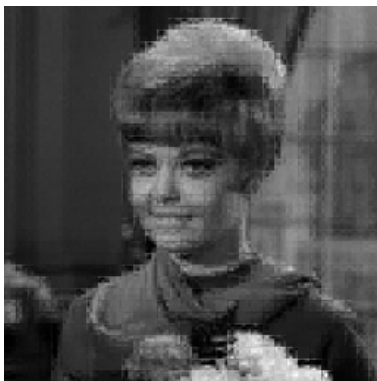
(b) 従来手法の復号画像 情報量 約 80%