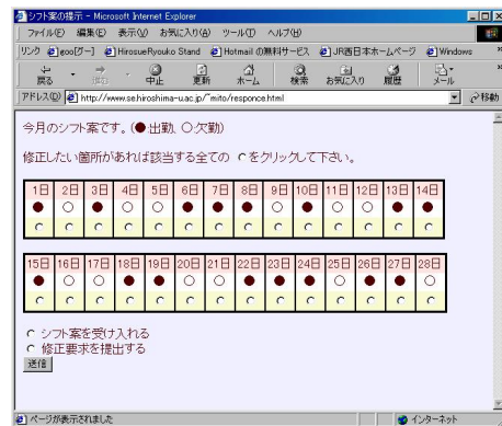
図 4: シフト案提示インタフェース.

本稿では、ユーザからの非明示的な要求の自動獲得手法の提案を行った。提案手法はビットベクトルから特徴ベクトルへの射影を行い、特徴ベクトル空間上で非明示的な要求を獲得するというものであった。本稿では提案する自動獲得手法の具体例として勤務表作成問題を取りあげ、各段階での具体的な手法の検討を行った。しかしユーザの意図しない要求