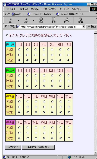
図 3: 出欠勤希望リスト入力インタフェース.