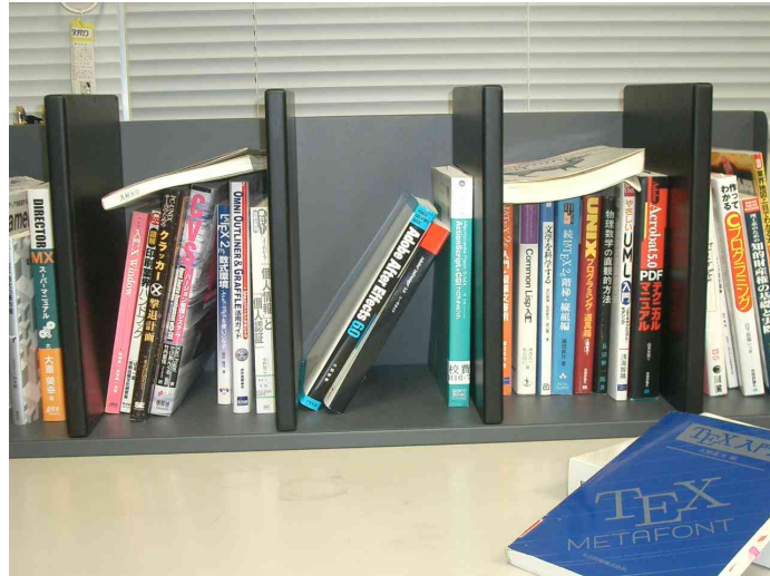
図 5: 複数タグの一括読み取り実験。2冊を横にした状態で配架、中央の2冊を極端に倒した状態で配架、さらに1冊を手前に置いている

図 4 が実験に使用した配架状況である。あまり窮屈にならないよう配架し、通常通り直立した状態で配架している。ただし、多少の空白があるため、自然に傾いたものもあるが、そのままの状態を計測した。計測は 10 秒毎に計 100 回行い、30 個全てのタグを 100 回とも問題なく読み取った。