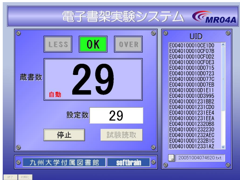
図 2: タグ読み取りプログラムの画面表示例