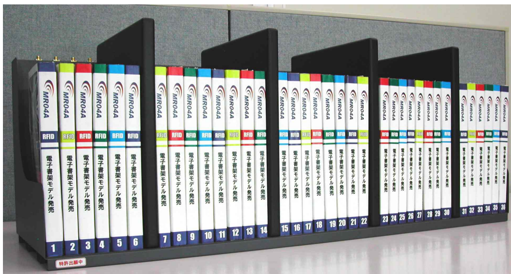
図 1: RFID リーダ付き書架。サイズは 900(W) × 312(H) × 290(D) である。固定された 4 つのブックエンドが RFID リーダである