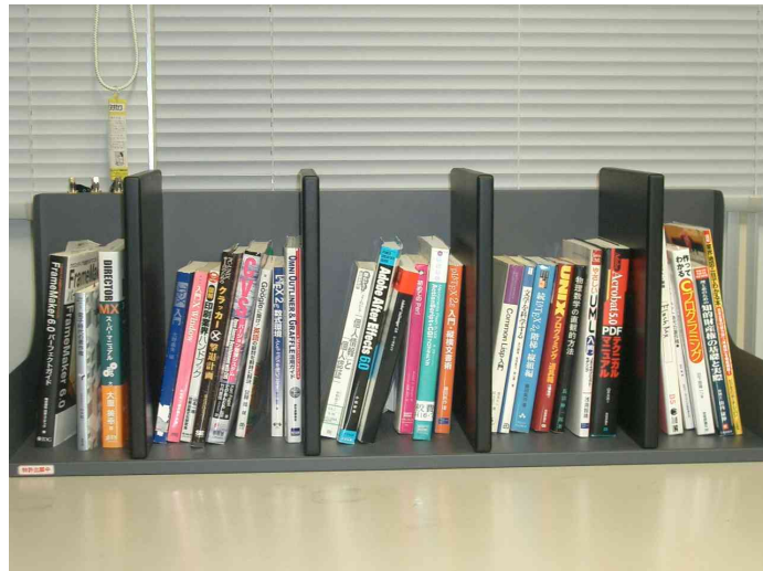
図 4: 複数タグの一括読み取り実験。多少傾いた本もあるが、基本的に自然に直立した状態で配架している