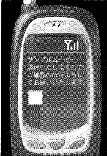
図3 携帯電話における物理的な 触覚表現の事例