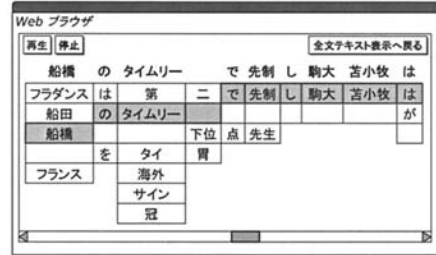
図2: 「音声訂正」 14) に基づく音声認識誤り訂正用インタフェース（通常の認識結果の下に競合候補が提示される）

ユーザが、検索したポッドキャストを「聞く」だけでなく、テキストで「読む」ことができる機能であ