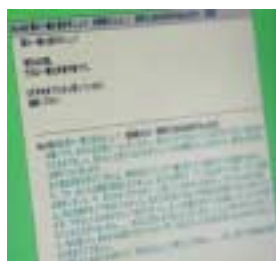
図1 仲間を募る書き込み

いかに「自殺系」とは言え、そのような書き込みは厳しく批判されるし、管理人も削除をためらわない。したがって、掲示板で相手を見つけた後は、メールや電話で打ち合わせを行い、実行直前に出会っているようである。図1はそのような決意表明であり、タイトルは「誰か一緒に逝きましょう」、内容は「場所は京都、方法は一酸化炭素中毒です。5月中旬までにはと思っています。連絡ください」とある。掲示板はたくさんあって閉鎖と開設が繰り返されるため、いつ誰がどこで掲示したものは不明である。