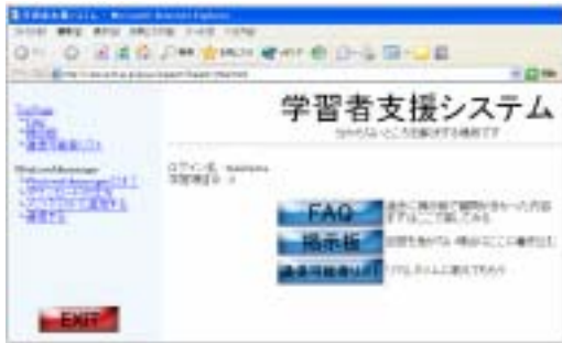
図 6：学習者支援システム

が用意されている。ここに来た学習者は、まず「FAQ」で分からない内容が、過去に質問された内容の中にないか探す。なかった場合は、「掲示板」に書き込み返答を待つ。今すぐリアルタイムな教え合いを希望する場合は、「通信可能者リスト」に行く。そしてシステムがマッチングする。教えられる可能性が高いメンバの中から選び出し、Windows Messenger で通信し、質問する。ここで、マッチングされるメンバは、教師はもちろん、その項目の演習問題を過去にパスしている学習者も選ばれるので、学習者同士の教え合いも可能になっている。