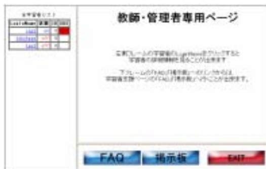
図 5 : 教師用システム