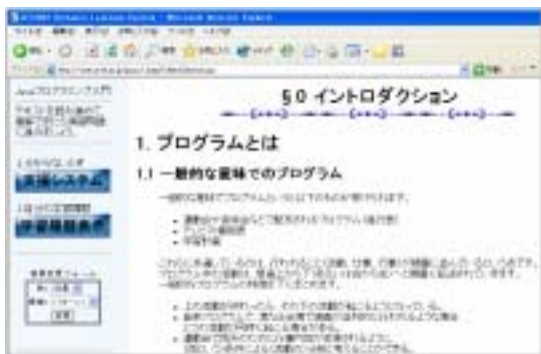
図 3 : 学習システム