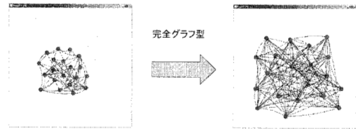
図1: 次数が増大する変化：(a) 初期世代の最良解、(b) 最終世代の最良解

巡回セールスマン問題におけるO型とC型の解空間の構造 [山村 92] と類似したものである。