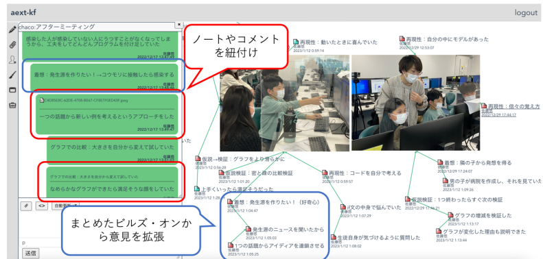
図2. 紐付け機能 (機能2)

(comment)」はビュー内に表示されない。貢献されたノートはビュー内を自由に移動可能であるのに対し、chaco に貢献されたコメントは時系列順に表示されるのが特徴である。