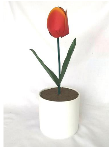
図 1 Bloom

「生き物らしさ」を得る上で「アニマシー知覚」[4]というものがある。アニマシー知覚とは対象物に意図や生物性を感じることを指し、対象が生物のみならず非生物の場合にも生じるとされている。代表例として、Heider と Simmel によるアニメーション[5]が挙げられる。これは、三つの図形の動きから図形同士の社会性を表し、アニマシー知覚を感じさせるものである。外見に囚われず、動きによって「生き物らしさ」を感じることができ、社会性、意図、意思、不気味さなど多様なものでアニマシー知覚が生じることがある。