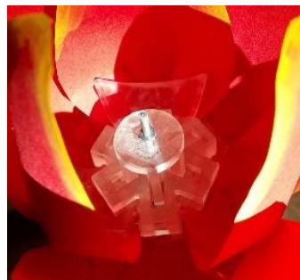
図 3 開閉機構の外観

花卉の開閉動作を行う機構を図 3 と図 4 に示す。植木鉢に内蔵したサーボモータにより茎の内部にあるシャフトを上下させることで開閉制御を行っている。シャフトが上下することにより、シャフト先端に取り付けられたパーツが花卉のパーツにある突起部分を押し、花卉は開閉する。これらの機構は、花卉の中央に収納する形にして、外部から見えないように工夫した。