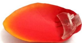
図 2 タント紙で作られた花卉

花卉はタント紙を用いて形状を組み立て、それに花を開閉させる機構に組み合わせるパーツを花卉の付け根部分に固定している。花卉の淵は水性の塗料で塗装し、見栄えが良くなるよう図 2 のように調整した。