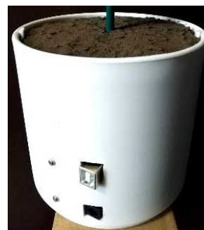
図 5 植木鉢の外観

植木鉢は、市販されている円柱型の植木鉢を使用し、内部にサーボモータと Arduino Uno を収納している。植木鉢上部に装飾した地面を模したパーツは、植木鉢にはめ込むことが可能な大きさの丸い板を作成し、その板にジオラマ用の土色の塗料を使い荒く塗装することで地面のざらざらした質感を再現した。