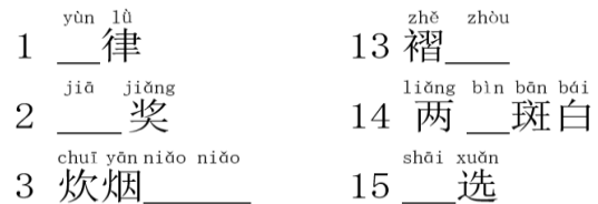
図 2 書き取りテスト問題の一部

Step 2. EE-Reader を利用し、図 1 に示した 3 種類の字形 (PS 字形, GIM 字形, Normal 字形) のいずれかによって表記された課題漢字を含む文書を読む作業。Step 1 の 15 日後に実施。