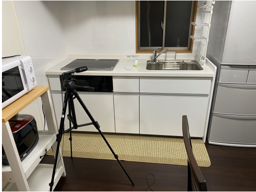
図 2: 実験環境