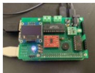
図 1 オンライン形式で受講者に配布したデバイスボード

プログラム開発は 1 回目の講座では Raspberry Pi にモニター・キーボード・マウスを接続し直接 GUI から行ってもらっていたが、2 回目の講座では各自宅の環境で PC さえあれば受講が出来るように Raspberry Pi 上の Node-RED サーバに各個人の端末からブラウザでアクセスする形式とした。