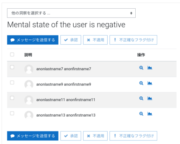
図 3 アナリティクス用の独自のターゲットによる洞察の例)