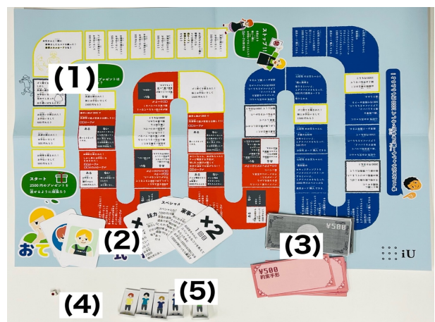
図 1 「お手伝い株式会社」で使う小道具