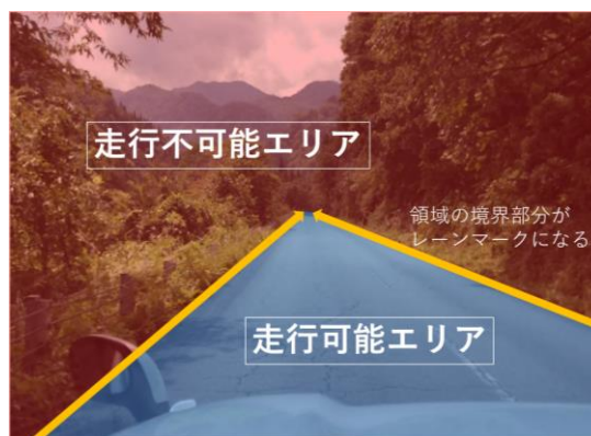
図7 エリア認識に基づくレーンマーク推測図