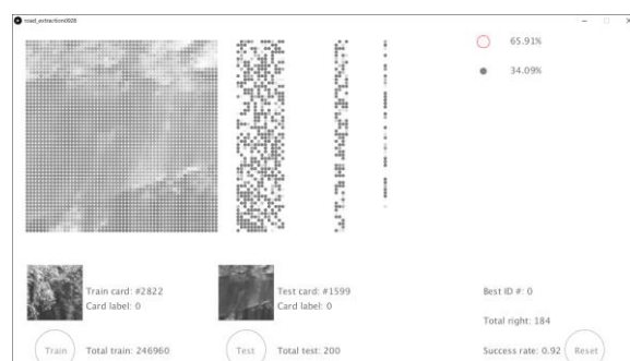
図4 ニューラルネットワークの実行画面1 Figure 4 Our original neural network - execution screen1

入力は 56 \times 56 の画像データを利用するため, 入力層のノード数は 3136 である. 出力は走行可能エリアと走行不可能エリアの2種に分類するため, 出力層のノード数は2である. 中間層は, 図4, 5の場合, 中間層の第1層から順にノード数が 784, 196, 49 である. ニューラルネットワークの層数, ノード数については, 学習を進めながら, 結果の正解率の変化を追跡し, 最適値を探索していきたい.