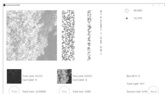
図5 ニューラルネットワークの実行画面2 Figure 5 Our original neural network - execution screen2