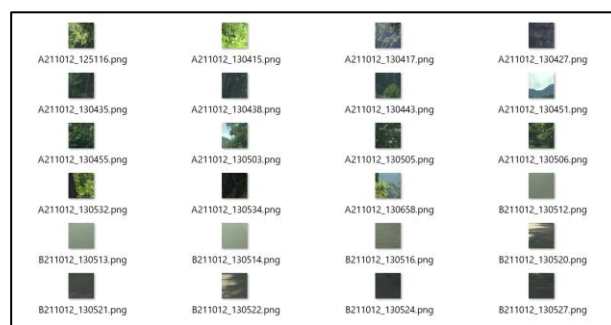
図3 教師データが保存されたフォルダ Figure 3 A folder saving the teacher data