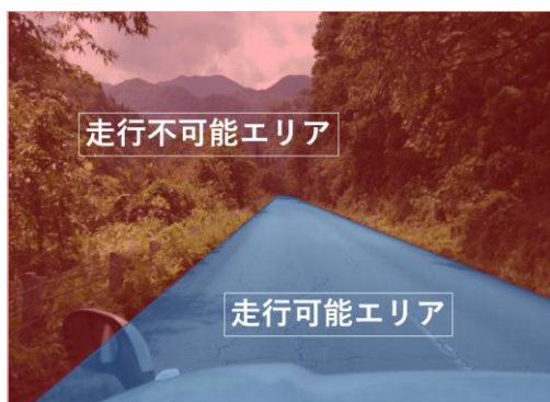
図1 走行可能エリアと走行不可能エリアの仮想分類図 Figure 1 Virtual classification map of drivable areas and un-drivable area