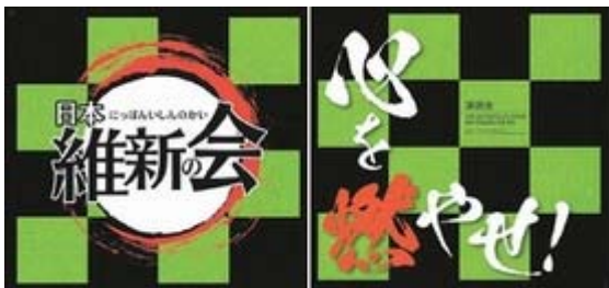
図 6 維新の会尼崎市議作成ポスター（[27]より）

維新の会の尼崎市議が「鬼滅の刃」風のロゴを用いたポスターを作成した件では、「兵庫県尼崎市議の光本圭佑氏（41）の政治ポスターに「人気アニメ『鬼滅の刃』のデザインを流用しているのではないか」との指摘が相次ぎ、所属する日本維新の会兵庫県総支部「兵庫維新の会」は8日までに、光本氏を嚴重注意処分とした。」「光本氏によると、原作漫画の出版元、集英社（東京）に市松模様などの使用が権利侵害に当たらないかどうか確認した上で、今回のポスターを200部作成、1月下旬から約50部を掲示したところ、ネット上で指摘が殺到したため、全て回収したという。」との事態に至った[27]。同市議は、事前に集英社に確認したようであり、集英社においても必ずしも違法反としての対応は取っていないようであるが、必ずしも違法でないとしても、大きなレピュテーションの毀損を伴った例といえよう。