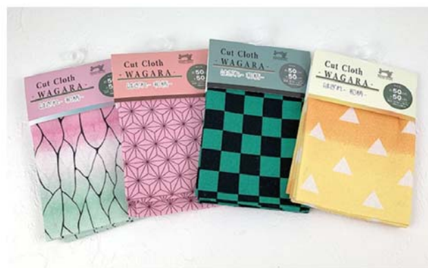
図 4 ダイソーの「鬼滅風はぎれ」(25)より)

海賊版グッズが基本的に著作権法違反であるのに対して、便乗グッズは(本稿の定義上)著作権法違反ではないため、対応は困難である。例えば、ダイソーが販売している「Cut Cloth WAGARA」(図4)などは、「売り切れる前にいそげ! ダイソーの新作「鬼滅風はぎれ」」等と紹介されているが[25], 伝統的な地模様で著作権は発生せず、前述の商標登録も完了していない段階では、対応できないものと思われる。