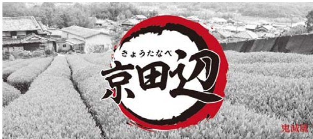
図 5 京田辺市作成のロゴ

( https://www.facebook.com/citykyotanabePR/posts/3438517042922202 より)