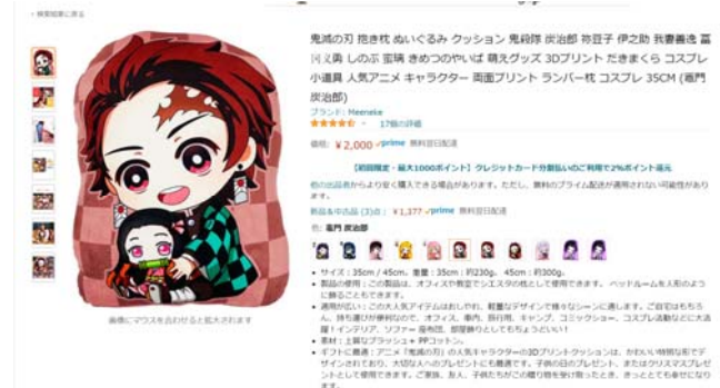
図 7 AMAZON.co.jp に見られる海賊版グッズ