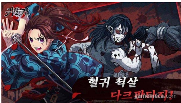
図 3 「鬼殺の剣」イメージ画像