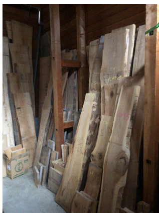
図 5 板の倉庫の例

今回は検証していないが、板の管理には、RFID による管理は向いていると考えている。図5のように、板の倉庫では様々な大きさや樹種の板をまとめて保管しているため、1枚ずつ探し当てるのは時間がかかる。特に、一枚板テーブルに用いる板は、1枚ごとに製造状況を管理する必要があるが、見分けが難しい場合があり、RFID によるタグ付けにかかる時間よりも、正確に管理できるメリットのほうが大きいと考える。