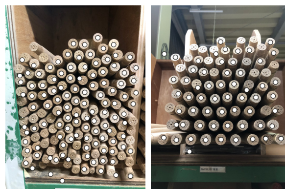
図 3 画像認識の確認結果(左 : No.1, 右 : No.2)