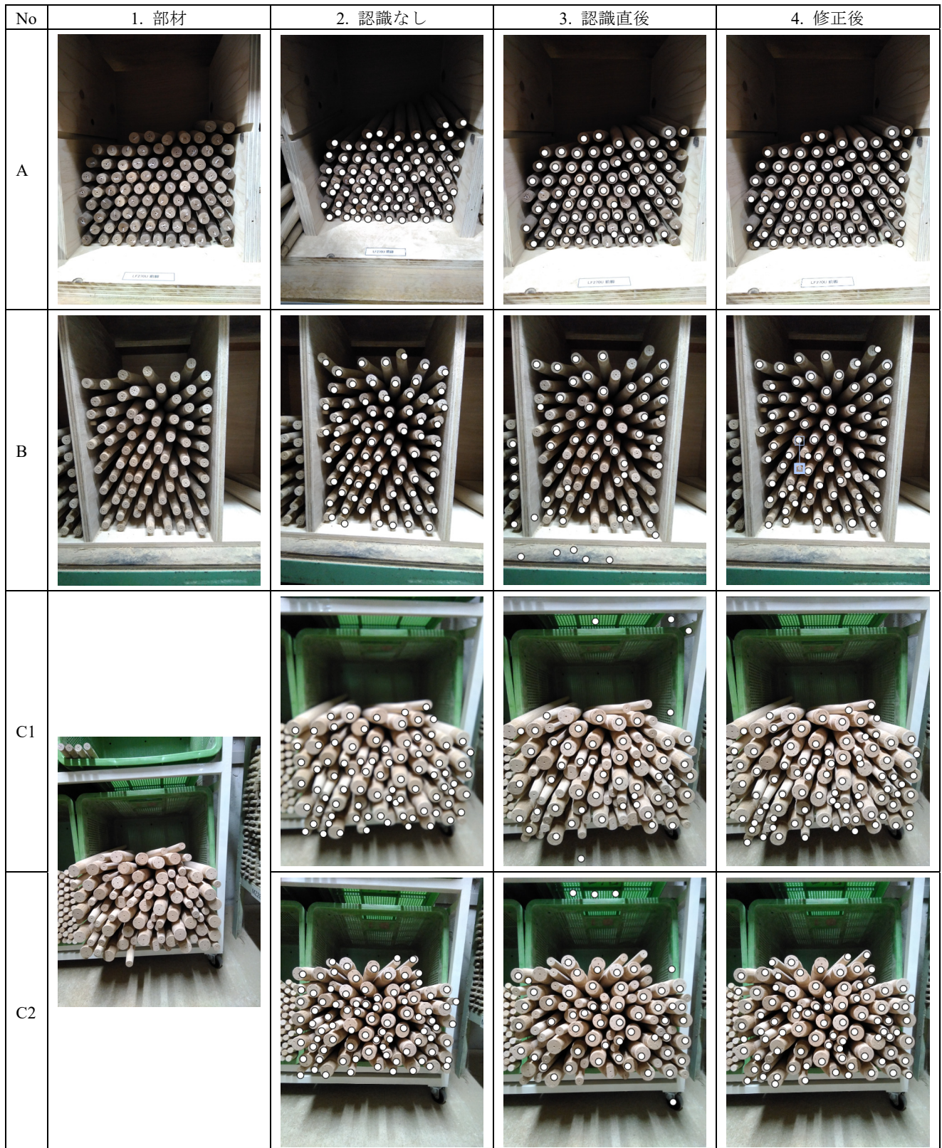
表 4 部材と評価時の画像