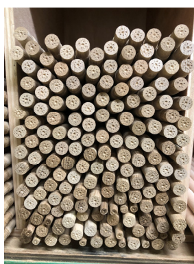
図 1 不規則に並ぶ丸棒の例

そこで本研究では、作業者の負担を現状より軽減したうえで、正確に在庫管理を行うことを目的とする。本稿は、重量センサ、RFID、画像の方法を木製家具製造業に適用した場合について検討する。画像を用いる方法については、検討を進める上での基盤を構築するため、カウント支援 Web アプリケーションを開発した。各方法を用いて木質部材の数を数えた時の本数と時間の比較を行い、カウント作業の効率化を目指す。