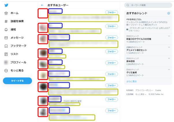
図 1 Twitter のおすすめユーザー

投稿内容やプロフィールを一人一人精査する必要があり、フォロー対象を探す作業に大きく時間を費やしてしまうという問題が存在する。