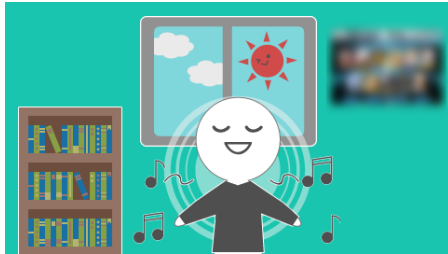
図 3 ユーザの投稿情報に基づいて生成された画像