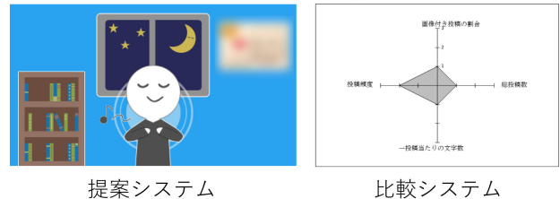
図 5 各システムにおける可視化