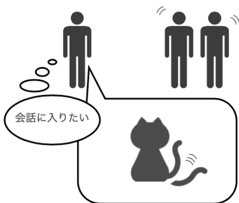
図 2 提案デバイスの例：楽しそう