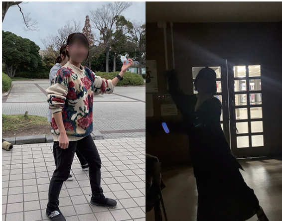
図 4 実験中の被験者の様子