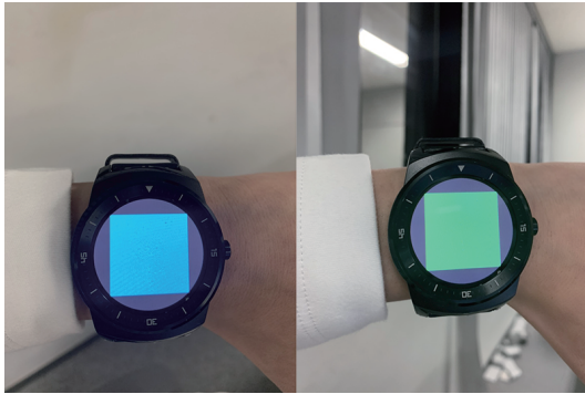
図 3 腕の振りによる画面の色の変化

1: 強く同意しない, 2: 同意しない, 3: どちらともいえない, 4: 同意する, 5: 強く同意する