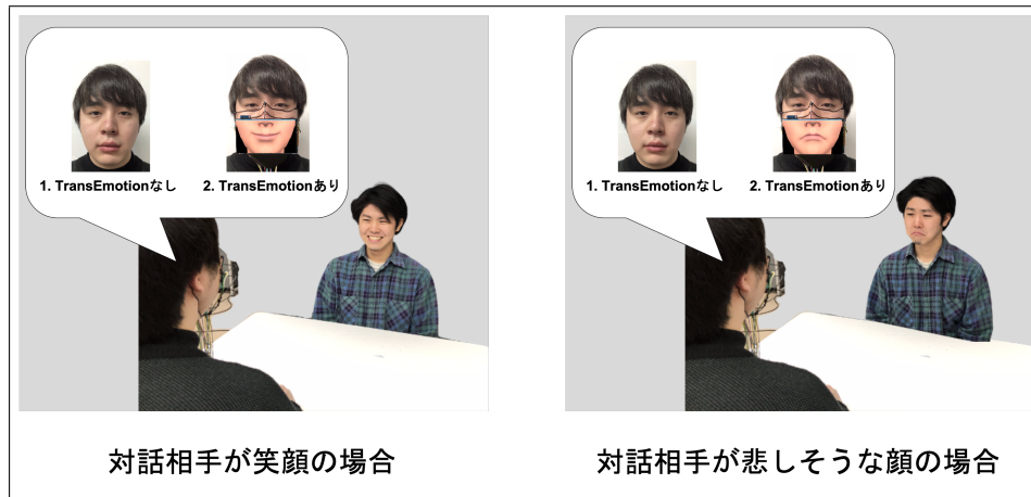
図 1 対話相手の表情に同調して仮想口唇の形状を変える TransEmotion コンセプト