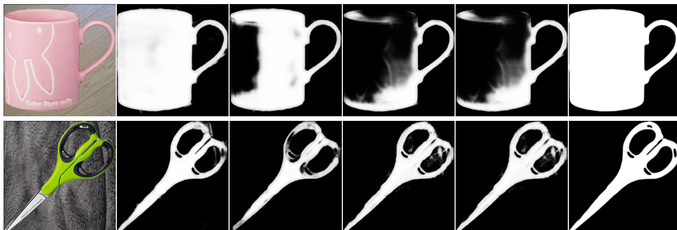
図 2: クラス情報あり,なしの定性的比較. 左から入力画像, 10:90 のクラス情報なし, 10:90 のクラス情報あり, 5:95 のクラス情報なし, 5:95 のクラス情報あり, 正解画像.