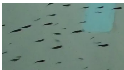
図3: 使用するフレーム画像

実験には近畿大学水産研究所で撮影した, 水槽でバースト遊泳中のクロマグロ稚魚の映像を用いる. 映像中には波による水面の揺らぎや光の反射が写り込んでいるため, 可能な限り魚影が不鮮明でない部分を縦横が 360 \times 640 となるように切り取り, データセットとする. 学習データの映像は全 90 フレーム, テストデータの映像は全 60 フレームである. データセットとした映像のフレーム画像を図3に示す.