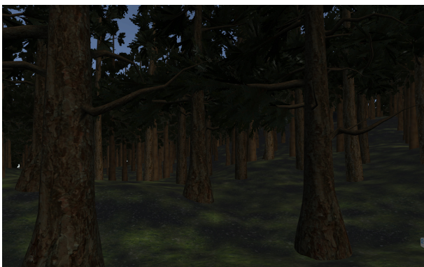
図 3: 実験 2 で用いる予定のシーン.

図 2 に本実験の結果を示す. 注視点の分布が聴覚刺激によらず変化がないことがわかる. 実験 1a, 実験 1b はそれぞれ 3 回行ったが, 結論として単純な聴覚刺激だけでは視線の誘導は行えないことが判明した.