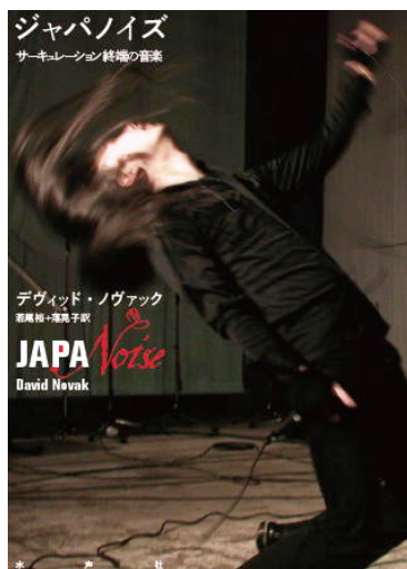
図4 ジャパノイズ Figure 4 JAPANoise.

図4の「ジャパノイズ～サーキュレーション終端の音楽」は、2020年2月にSUACのメディアデザインウイーク(MDW)で「スケッチングワークショップ」[52]を行った時に入手した、2020年1月出版の本であり、「デヴィッド・ノヴァック(著) 若尾裕・落見子(訳)」のハードカバー(A5判上製、328ページ、4,000円+税)である。筆者は日本音楽即興学会(JASMIM)[53]の会員ではほぼ毎年、年末の大会に発表参加しているが、この新しい学会の設立者が若尾裕氏であり、その教え子で現JASMIM会長である落見子氏は、RAKASU PROJECT.として何度もMDWワークショップ講師をお願いしてきた筆者の友人であり、今回は一参加者として大活躍しつつ、「こんな本が出ました」とこの「ジャパノイズ」を寄贈してくれたのである。