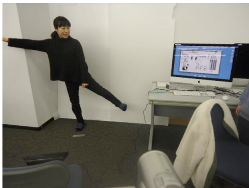
図1 チーム「落」の作品例 Figure 1 The installation work of team "Ochi".

年、毎年開催している。ここではSUAC/他大学の学生作品展示、関連領域の専門家を招いての講演会、に加えて、筆者は「スケッチング(物理コンピューティング)」のワークショップを毎年、開催している。作品展示や講演会は一般公開しているのに対して、SUACの設備を2日間にわたって使用するワークショップは事前申込制であるが無料であり、地元近隣のメーカ技術者(ヤマハ・ローランド・カワイ・浜松ホトニクス等)や地元の高校教員だけでなく、関東/関西の大学教員や学生なども噂を聞きつけて参加し、2020年2月には鹿児島からの参加者もいた。毎回テーマを設定して専門家を講師として招くが、参加者をグループに分けて「1日で何かを作り上げる」というハンズオン・ワークショップは毎回、多くの成果を生みだしてきた。本稿では紙面の関係で2020年2月のMDWワークショップの参加者2チームが1日で制作しプレゼンした2作品[49]のみ紹介するので、過去の作品は「SUACインスタレーション」[44-48]のページにMDWの記録(参加募集/フォトレポート/YouTubeリンク)があるので参照されたい。