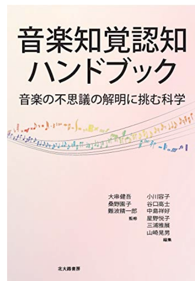
図3 音楽知覚認知ハンドブック Figure 3 Handbook of Music Perception and Cognition.

学会HP[50]の中にある「学会発足の経緯」[51]のように、1988年に日本音楽知覚認知研究会として発足し2014年に日本音楽知覚認知学会として改組された「日本音楽知覚認知学会」の歴史は音楽情報科学研究会(任意団体から情報処理学会の研究会となったのは1993年)よりも古い。かつては両者のメンバーはかなり重複して熱心な議論を重ねてきたが、最近では重複メンバーがほぼ皆無となり、その証拠には2020年6月の音楽情報科学研究会(音学シンポジウム)は日本音楽知覚認知学会春季研究発表会と日程が重なっていて、両方に所属する筆者は無理矢理の排他的二択を強制させられたのは残念なことである。