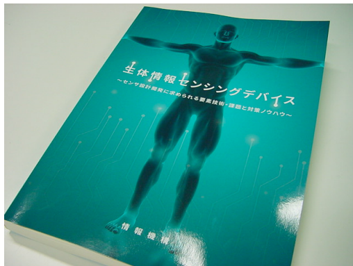
図 5 生体情報センシングデバイス Figure 5 Bio-sensing Devices.

というサブタイトルで分かるように、生体情報に関するビジネスを模索する企業に向けたノウハウ本であり、中身を細かく抜き出してプロ向けの技術セミナーを行う(こちらがメイン)のテキストとして出版されているようだが、ちゃんとISBNもあるし国会図書館にも登録されている(B5判、281ページ、60,000円+税)。