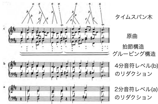
図2 GTTM タイムスパン木による階層的な簡約例 ([18], p.132 より抜粋) J.S. バッハ BWV244 マタイ受難曲より「血潮したたる主の御頭」冒頭

カーの簡約仮説に基づいた階層的な構造分析が特徴であるが、木構造を用いている点が大きく異なる。これは言語学の生成文法理論 *1 の影響であろう。