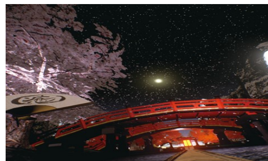
図 3 「Ideal Vacation」の視覚シミュレーション画像

夜の川を小舟でゆっくりと下っていくシーンをシミュレートした約 5 分のコンテンツ『Ideal Vacation』を実装した。コンテンツ内には体験者が体勢を傾け、コントローラを下方向に動かすことで水面に触れることができるものを用意した。実際のコンテンツによる視覚シミュレーション画面を図 3 に、体験者が水面に触れている様子とその時の視覚シミュレーションを図 4 に示す。