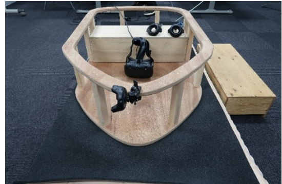
図 1 VR システムの全景

必要なため、3m 四方程度となった。また搭乗時は体験者が HMD を装着しているため、プレイテストでは安全確保のために補助員が誘導した。VR システムの全景を図 1 に、VIVE トラッカーを装着した様子を図 2 に示す。