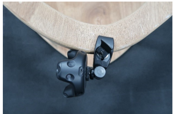
図 2 VIVE トラッカー装着