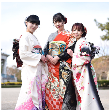
図 2 画像 ID1 の画像