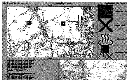
図2: 施設オブジェクトの表示