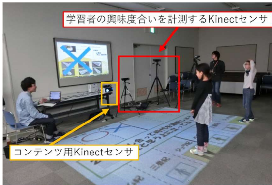
図 1 評価実験の構成 Fig 1 Overview of contents