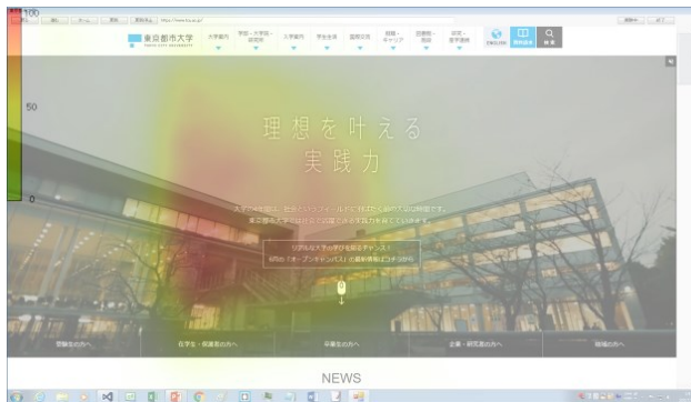
図 3 実験 A 時のアイカメラヒートマップ