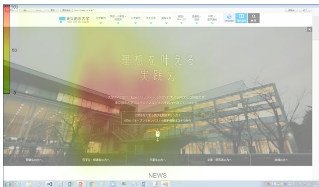
図 4 実験 B 及び実験 C 時のアイカメラヒートマップ