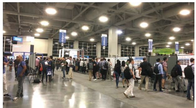
図-3 デモとポスターブース