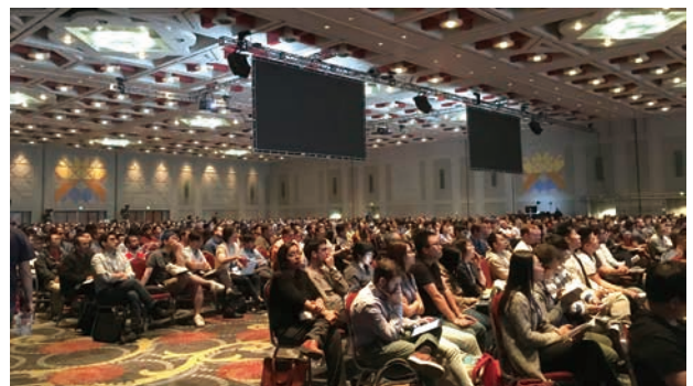
図-2 メイン会場の 1 つ