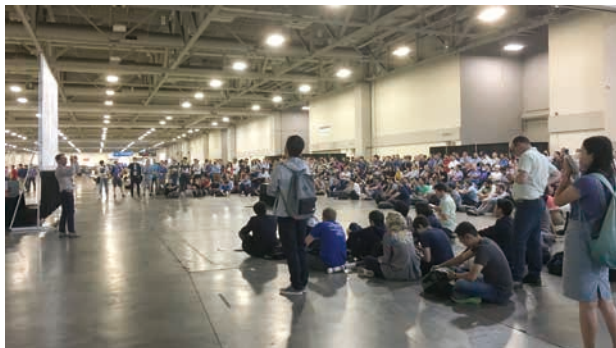
図-4 サッカーワールドカップを観戦する人々

前年に発表されたバッチ正規化（Ioffe&Szegedy, ICML 2015）は、深層学習の必須技術として広く浸透した。GAN関連の研究も登場し始め、特にPathakらはGANを敵対損失（adversarial loss） ☆3 として応用し、画像生成以外のタスクに適用させた。また、GatysらのNeural Style Transfer ☆4 もここで発表された。一方で、従来研究は存在感を減らし、全体として8割以上が深層学習を含む研究だったと思う。