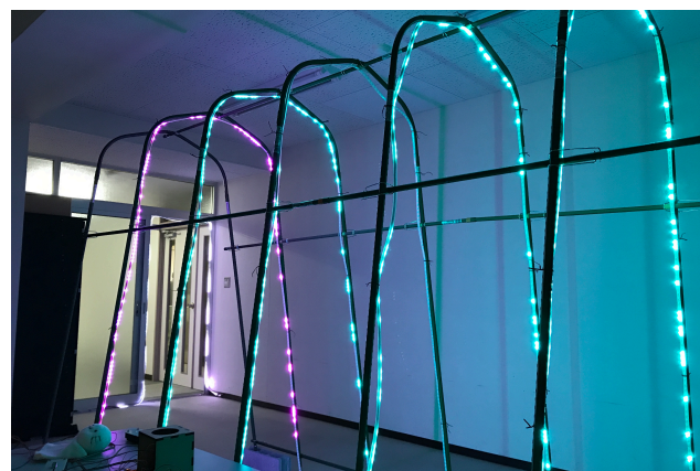
図1 アーチ状の骨組み

入力装置は制御装置に接続されており、またそれぞれの制御装置間も通信用のケーブルで接続されている。鑑賞者の入力装置へのアクションをトリガーとして制御装置同士が通信を行って情報を伝達し、情報を受け取った各制御装置が入力装置の種類に応じたパターンでそれぞれのテープLEDを発光させる仕組みとなっている。