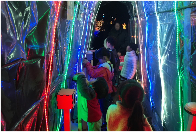
図 4 フィールドテストの様子

これらの反応から、公共空間にインタラクティブ性を持つイルミネーションを設置することにより、鑑賞者同士の交流が生まれたり、子どもが自発的に遊ぶ道具になり得たりすることがわかった。また、体験した鑑賞者が再度訪れたりすることや、まだ体験していない人にお勧めする等の行動が見られたことや、「操作できるイルミネーションはあまりないので、ぜひ来年度も展示してほしい」という要望の声が多数聞かれ、インタラクティブ性を持ったイルミネーションへの高い関心が伺われた。