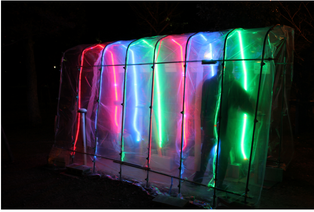
図 2 ビニールシートで覆った図