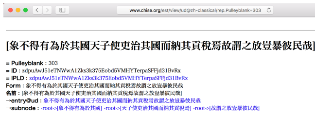
図 6 テキストオブジェクトに対応する EGT 頁の例

テキストオブジェクトに対応する UD 依存構造オブジェクトには ID 素性 =Pulleyblank を付け、その値に Pulleyblank の “Outline of Classical Chinese Grammar” [10] の例文番号を入れる。これにより、 http://www.chise.org/est/view/ud@zh-classical/rep.Pulleyblank=303 のようにこの例文番号に対応する UD の依存構造の情報を参照することができる (図 6)。