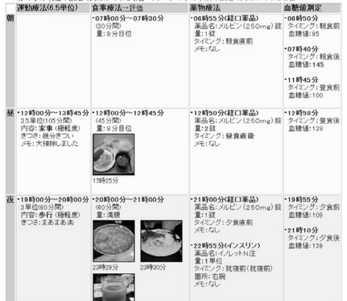
図4.報告内容一覧画面

2005年12月19日 ・青色の字は24時間以内に入力された内容 緑色の字は1週間以内の内容 黒色の字はそれ以前の内容 ・赤の字は現在の設定で異常があった場合 オレンジの字は以前の設定で異常があった場合