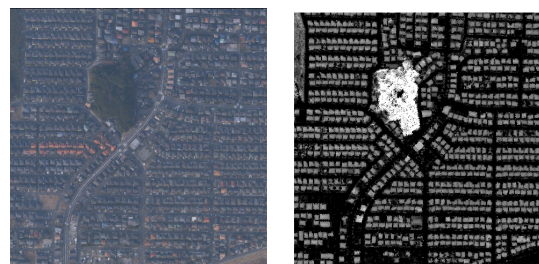
(a) 空撮画像 (b) DSDM 画像

‡ PASCO Research Institute, PASCO CORPORATION